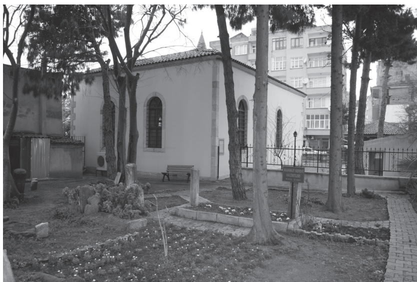
Приложение 1: Вид на двор соборной мечети «Кефевии» в г. Синоп, Турция с обзором могилы Махмуд ибн Сулайман ал-Кафави. Фото Ерджан-Канбур (ErcanKanbur), г. Синоп, Турция, 30 ноября 2012 г.