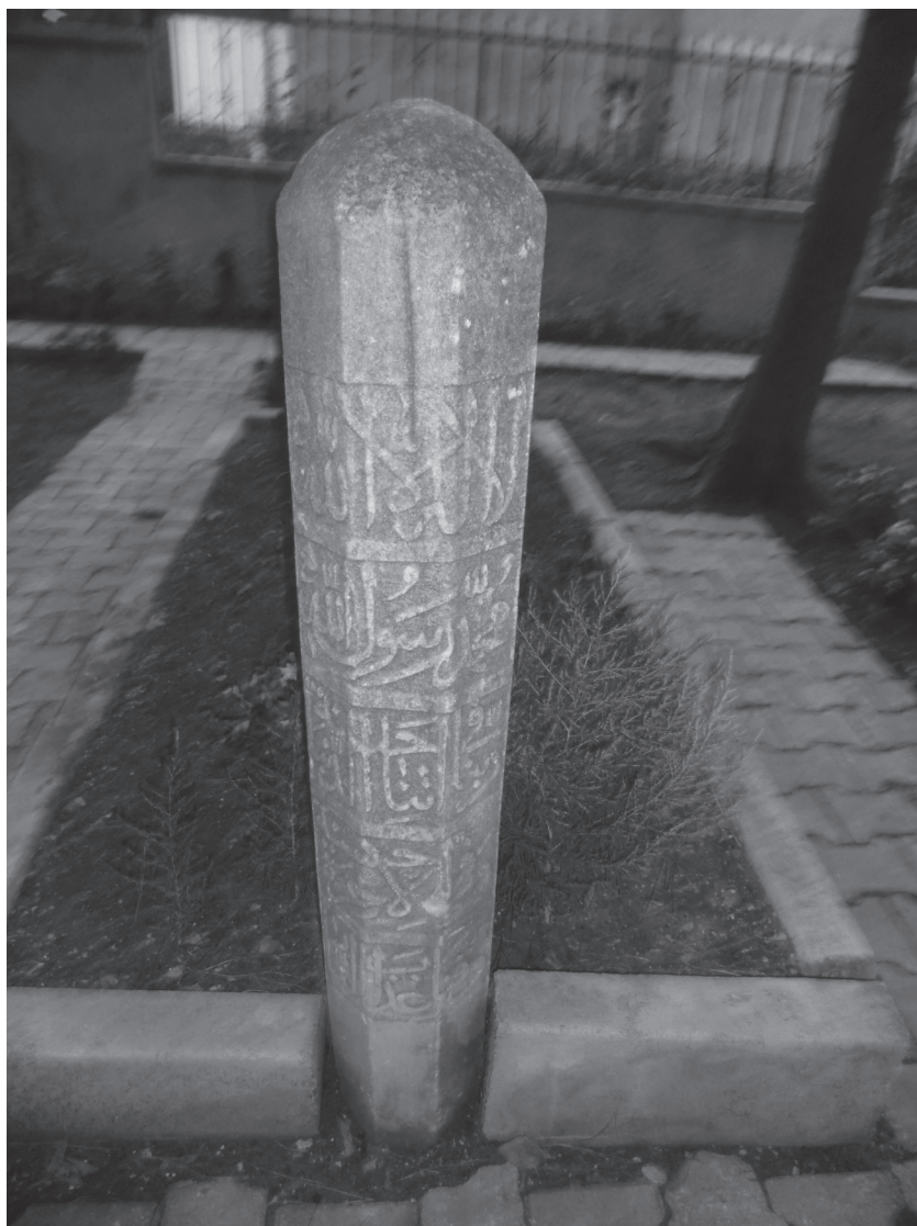
Приложение 5: Надпись на камни в нижней части могилы ал-Кафави (северная сторона). г. Синоп, Турция, 14 ноября 2012 г.