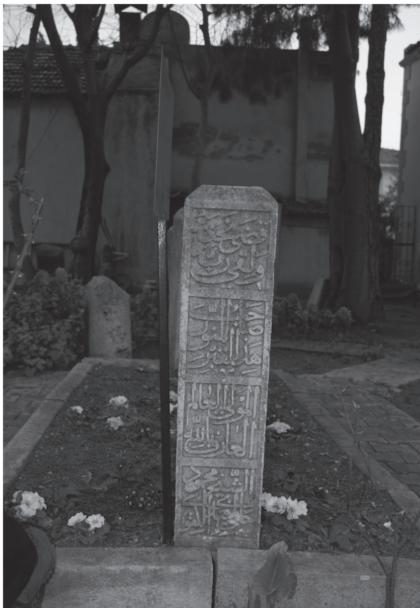
Приложение 2: Надпись на головном камне (южная сторона) на могиле ал-Кафави. г. Синоп, Турция, 30 ноября 2012 г.