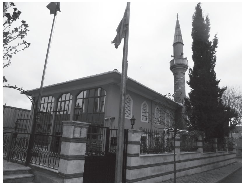
Стамбул. Фатих, Пазар-Текке.

Могилы Молла Гюрани. Она находилась во дворе несохранившегося до нашего времени медресе «Гюранийе», где ал-Кафави изучал исламские науки. Фото А.К. Муминова, 10 февраля 2013 г.