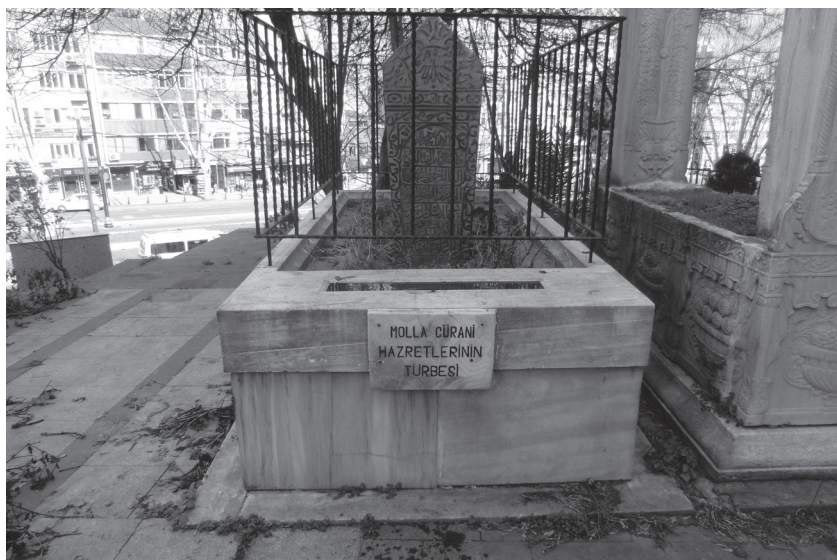
Стамбул. Фатих, Чапа.

Могилы Молла Гюрани. Она находилась во дворе несохранившегося до нашего времени медресе «Гюранийе», где ал-Кафави изучал исламские науки. Фото А.К. Муминова, 10 февраля 2013 г.