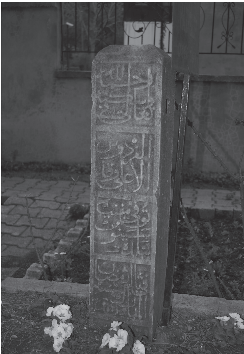
Приложение 3: Надпись на головном камне (северная сторона) на могиле ал-Кафави. г. Синоп, Турция, 30 ноября 2012 г.