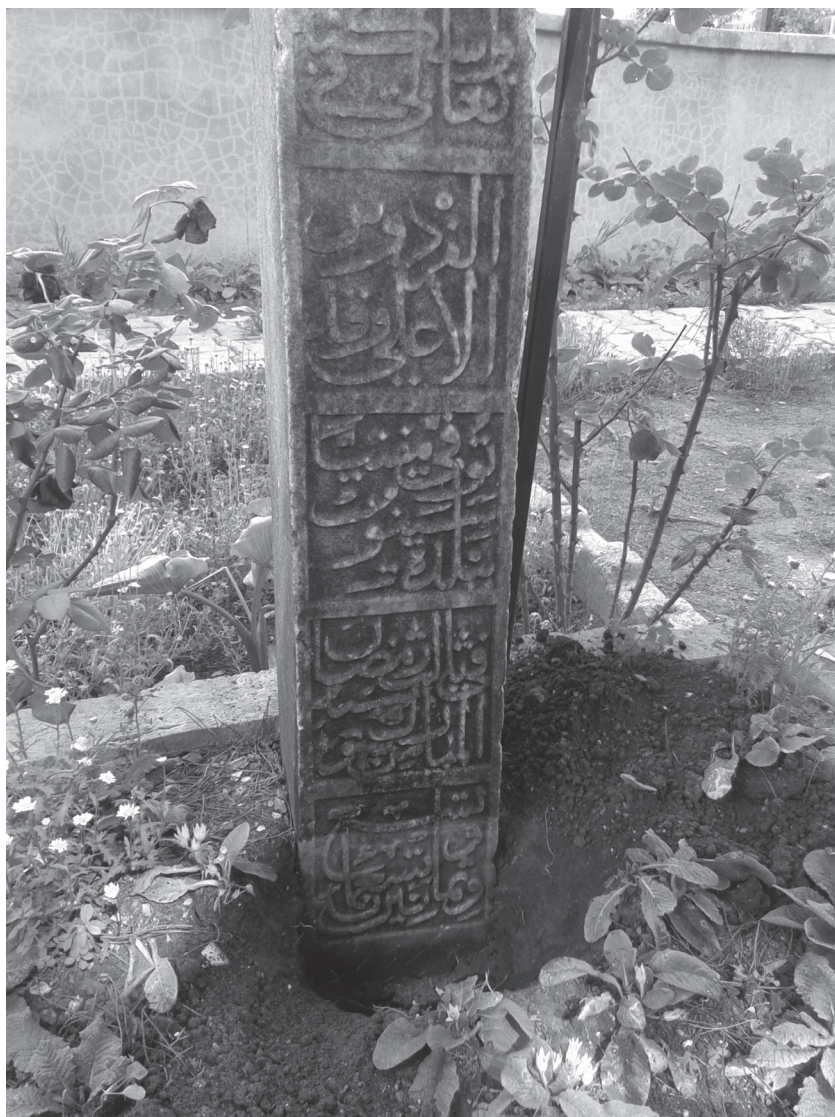
Приложение 4: Надпись на головном камне (северная сторона) на могиле ал-Кафави (после снятия грунта). Фото ШюкрюШахина (ŞükrüŞahin), г. Синоп, Турция, 17 июня 2013 г.